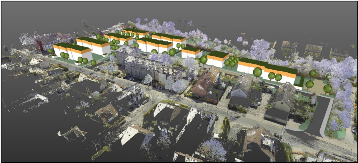
Vogelperspektive aus Nordwesten