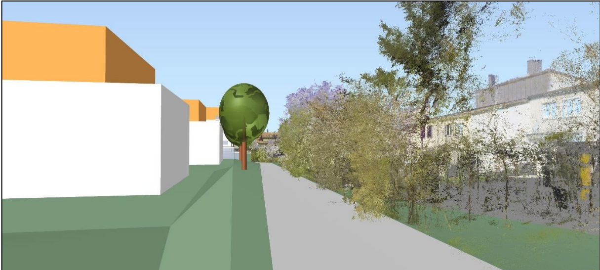
Blick aus dem Planungsgebiet (Geh- und Radweg am Ostrand des Planungsgebiets) nach Norden