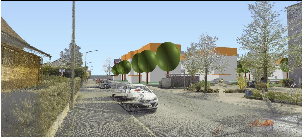
Blick von der Banderbacher Straße (Höhe Knoten Geisleitenstraße) in Richtung Osten