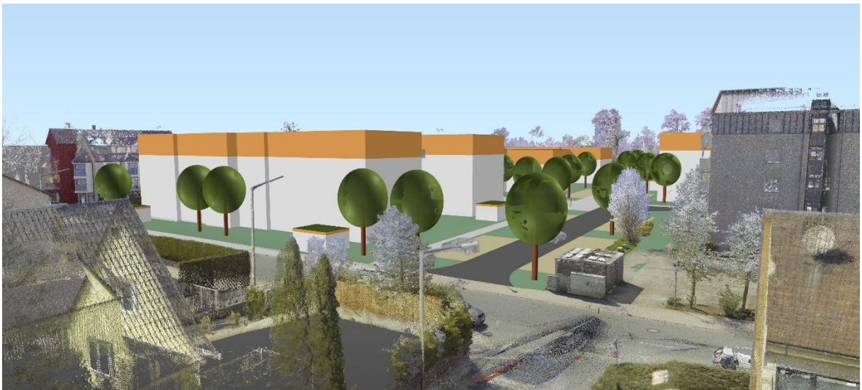
Blick von der Banderbacher Straße (Höhe Knoten Geisleitenstraße) in Richtung Süden