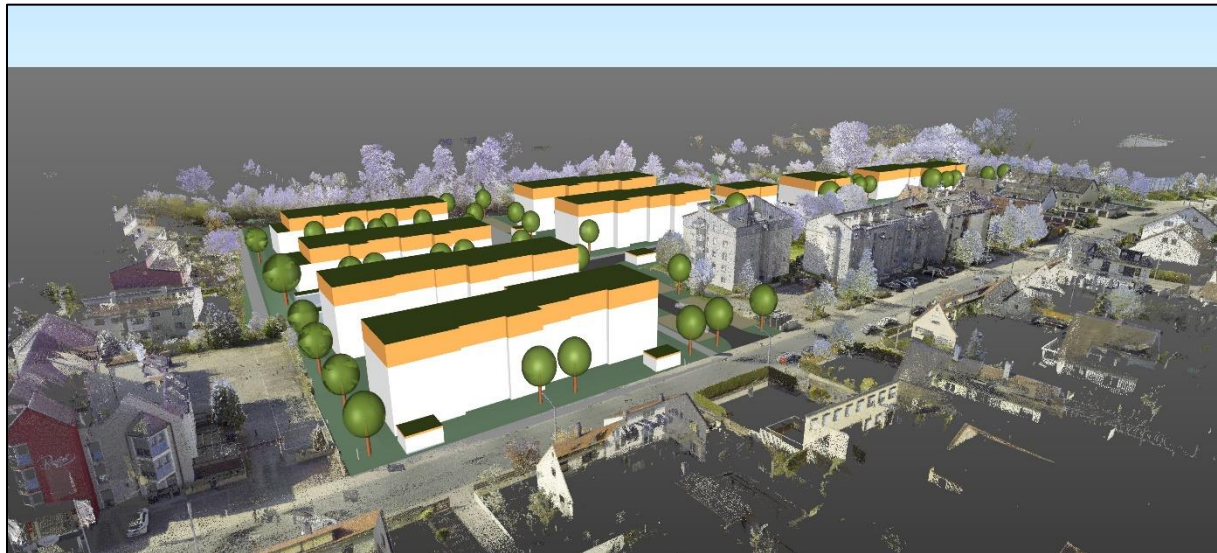
Vogelperspektive aus Nordosten