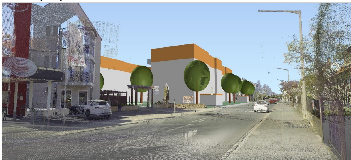
Blick von der Banderbacher Straße (Höhe Hotel Reubel) in Richtung Westen