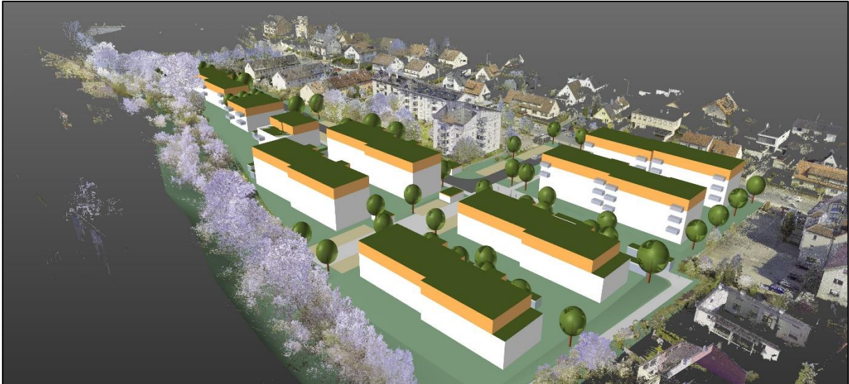
Vogelperspektive aus Südosten