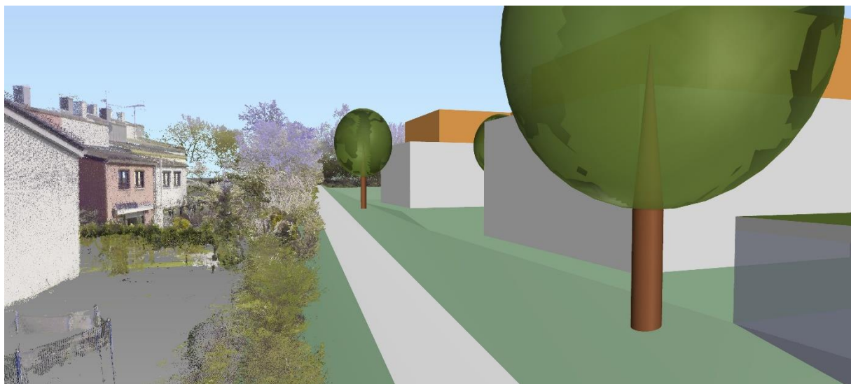
Blick aus dem Planungsgebiet (Geh- und Radweg am Ostrand des Planungsgebiets) nach Süden