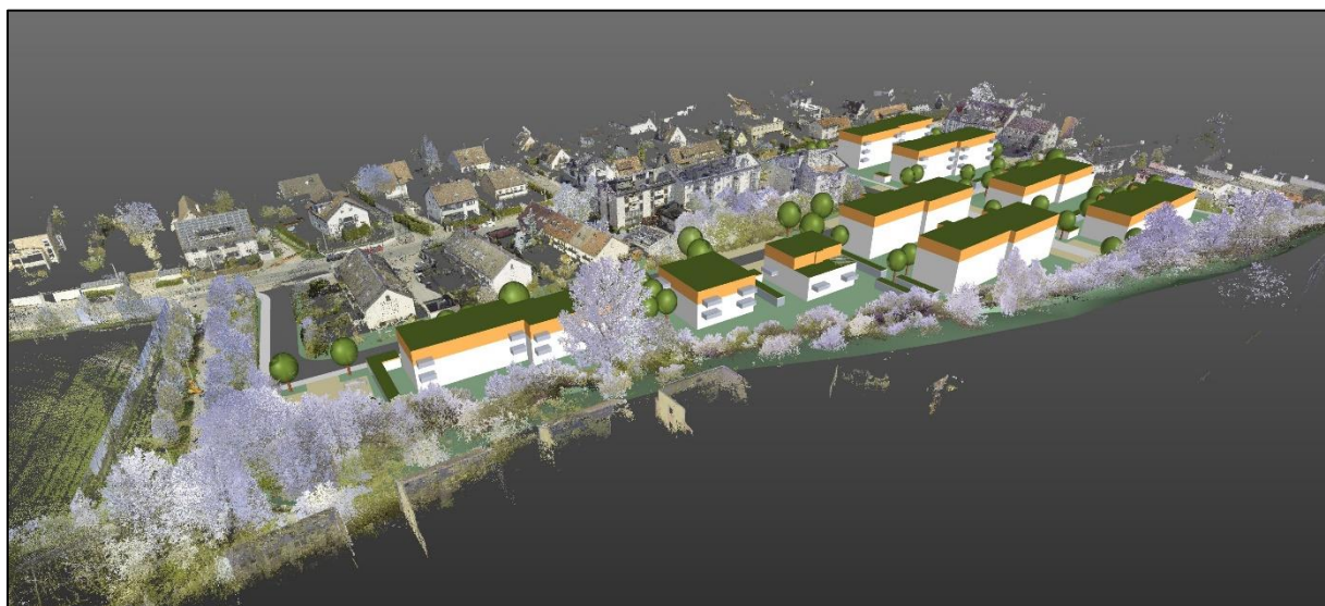
Vogelperspektive aus Südwesten