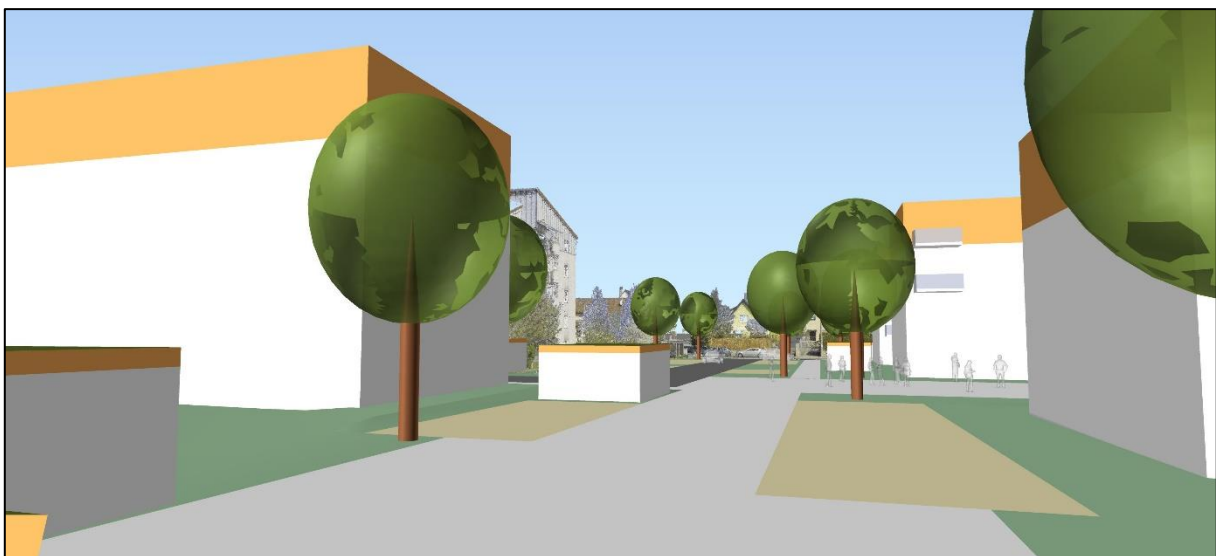
Blick aus dem Planungsgebiet (zwischen Baufenster WA 3 und WA 4) nach Norden