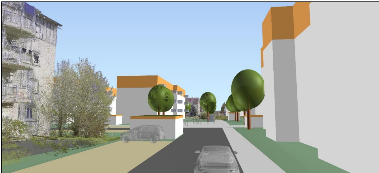
Blick in der Planstraße nach Osten