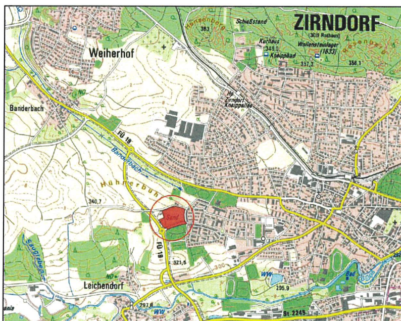
Übersichtskarte mit Kennzeichnung Geltungsbereich (rot markierte Fläche)