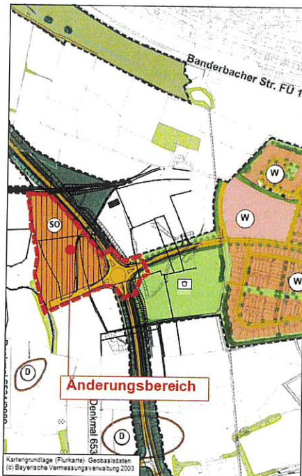
Auszug aus dem Vorentwurf zur Änderung des Flächennutzungsplanes

Zur frühzeitigen Öffentlichkeitsbeteiligung ist der Vorentwurf der Änderung des Flächennutzungsplanes für den Bereich „Rettungszentrum“ mit integriertem Landschaftsplan, bestehend aus Planblatt mit zeichnerischen Darstellungen und Vorentwurf der Begründung mit Vorentwurf des Umweltberichts gem. § 3 Abs. 1 PlanSiG i.V.m. § 3 Abs. 1 BauGB in der Zeit vom