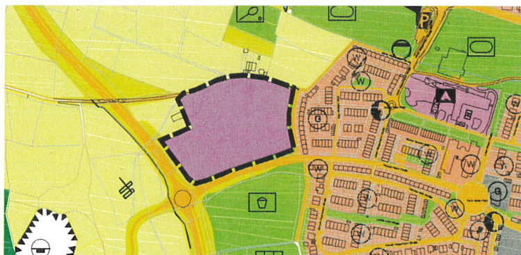
(Auszug Plandarstellung zur Änderung des Flächennutzungsplans der Stadt Zirndorf im Teilbereich „Sozialzentrum westliche Thomas-Mann-Straße“; © Kartengrundlage: Bayerische Vermessungsverwaltung

Das bisher als Flächen für Landwirtschaft dargestellte Areal wird nun als Sonderbaufläche (Sozialzentrum) gem. § 11 Abs. 2 BauNVO dargestellt.