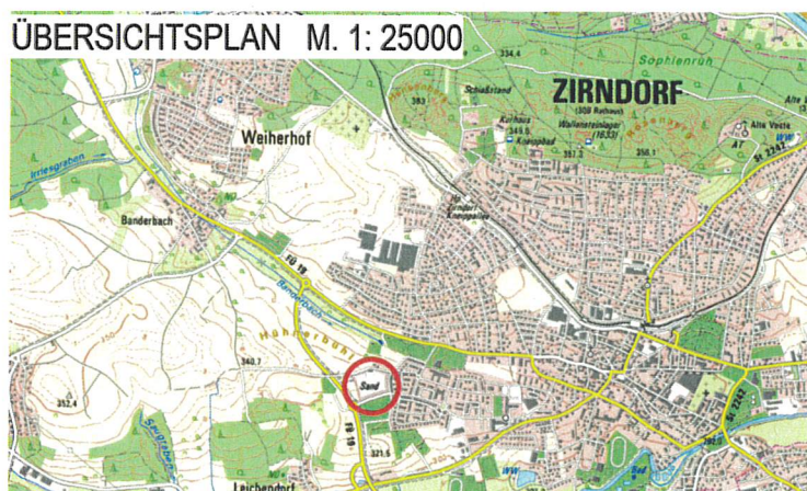
Übersichtskarte mit Kennzeichnung des Änderungsbereichs des Flächennutzungsplans (rot markierte Fläche); © Kartengrundlage Bayerische Vermessungsverwaltung

Das Landratsamt Fürth hat mit Bescheid vom 30.01.2024, Az. 44-6102-O-1202-2021-FC, die für das „Sozialzentrum“ erforderliche Änderung des Flächennutzungsplanes der Stadt Zirndorf für den Teilbereich „Sozialzentrum westliche Thomas-Mann-Straße“ in Zirndorf genehmigt.