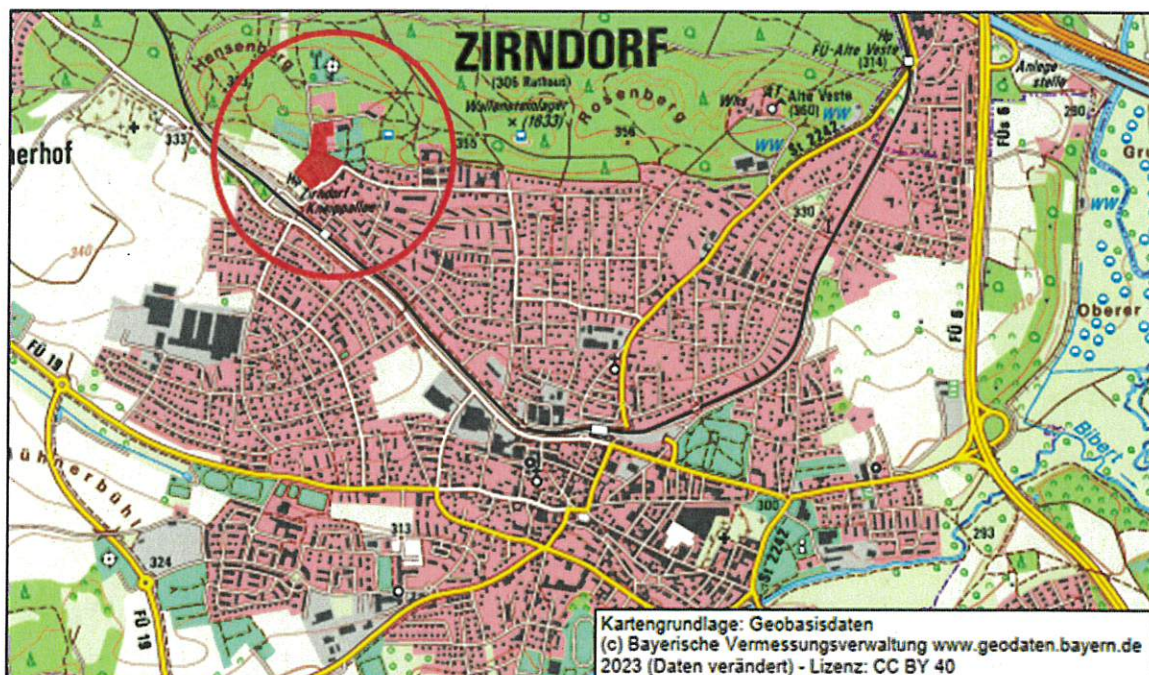
Übersichtslageplan zur Lage des Geltungsbereichs der Einbeziehungssatzung „Kneippallee - Am Achterplätzchen“, rot flächig markiert = Änderungsbereich; ohne Maßstab

Die Aufstellung der Einbeziehungssatzung „Kneippallee - Am Achterplätzchen“ erfolgt im vereinfachten Verfahren gem. § 13 BauGB. Es wird darauf hingewiesen, dass gem. § 13 Abs. 3 Nr. 1 BauGB die Aufstellung der Einbeziehungssatzung ohne Durchführung einer