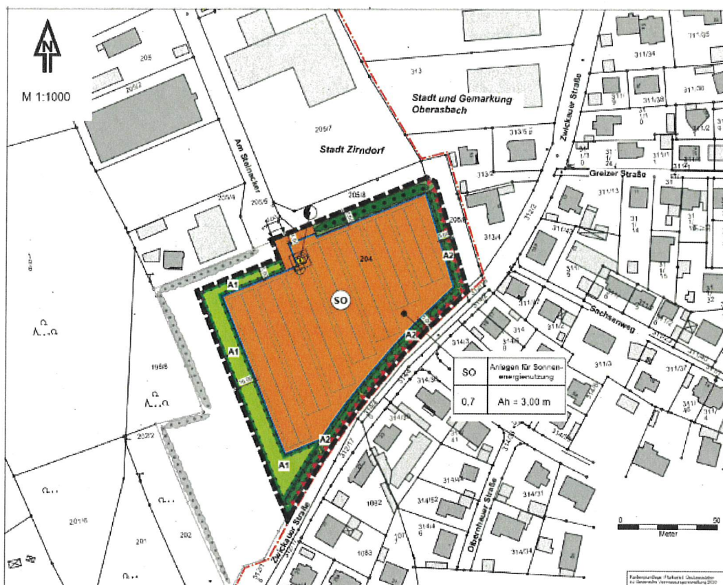
Auszug aus dem Planblatt des vorhabenbezogenen Bebauungsplans „Solarfeld Am Steinacker“

Jedermann kann den Bebauungsplan mit integriertem Grünordnungsplan „Solarfeld Am Steinacker“, bestehend aus der zeichnerischen Darstellung (Planblatt), Satzung mit textlichen Festsetzungen, Begründung, dem Vorhaben- und Erschließungsplan einschließlich Anlagen sowie die zusammenfassende Erklärung über die Art und Weise, wie die Umweltbelange und die Ergebnisse der Öffentlichkeits- und Behördenbeteiligung in dem Bebauungsplan berücksichtigt wurden, und aus welchen Gründen der Plan nach Abwägung mit den geprüften, in Betracht kommenden anderweitigen Planungsmöglichkeiten gewählt wurde, ab dem 03.11.2023 bei der Stadt Zirndorf