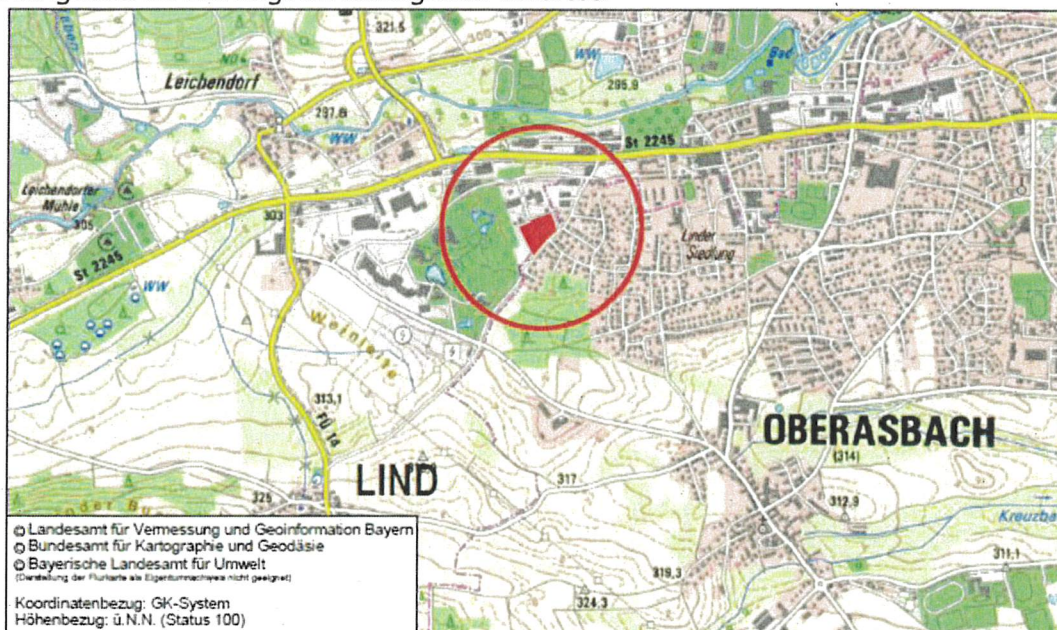
Übersichtskarte mit Kennzeichnung Geltungsbereich (rot markierte Fläche)

Das Plangebiet ist wie folgt im Stadtgebiet verortet: