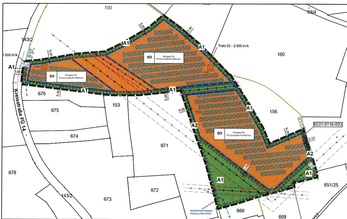
Auszug aus dem Vorentwurf des vorhabenbezogenen Bebauungsplans „Solarpark Leichendorf“

Der Vorentwurf des vorhabenbezogenen Bebauungsplanes mit integriertem Grünordnungsplan „Solarpark Leichendorf“ wurde erstellt und ist, bestehend aus Planblatt mit zeichnerischen und textlichen Festsetzungen, Satzung, Vorentwurf der Begründung sowie Vorentwurf des Umweltberichtes und den weiteren Anlagen gem. § 3 Abs. 1 BauGB in der Zeit vom