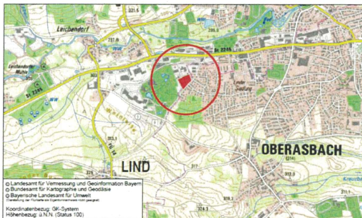
Übersichtskarte mit Kennzeichnung Geltungsbereich (rot markierte Fläche)

Das Landratsamt Fürth hat mit Bescheid vom 27.07.2023, Az. 44-6102-O-1439-2020-FC, die für die Errichtung eines Solarfeldes und Darstellung einer Sonderbaufläche erforderliche Änderung des Flächennutzungsplanes der Stadt Zirndorf für den Teilbereich „Solarfeld Am Steinacker“ in Zirndorf / Leichendorf genehmigt.